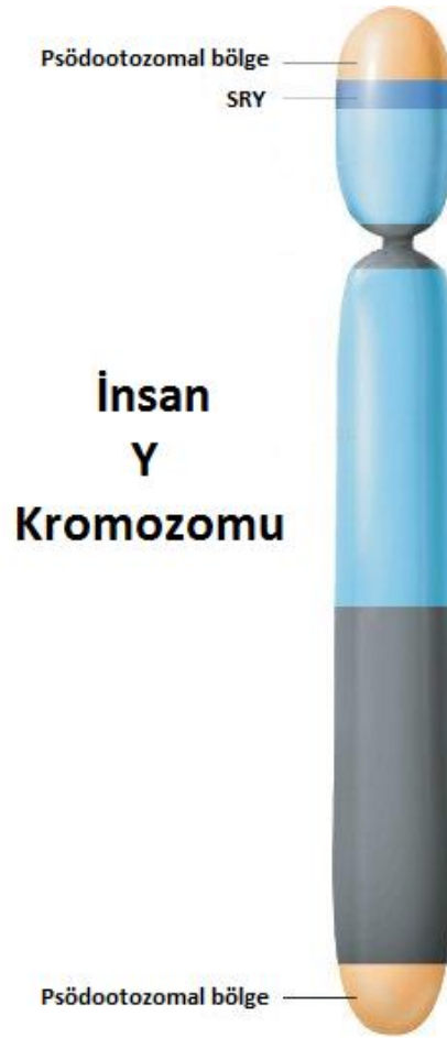
Şekil 2. Y kromozomu üzerinde, SRY ve psödootozomal bölgenin yakınlığı.

Erkek cinsiyetine ait yapıların şekillenmesini sağlayan SRY geninin, Y kromozomuna ait genetik materyal alışverişinin yoğun olduğu psödootozomal bölgeye yakın oluşu nedeniyle (Şekil 2); Y kromozomundan X kromozomu üzerine aktarılması muhtemeldir.